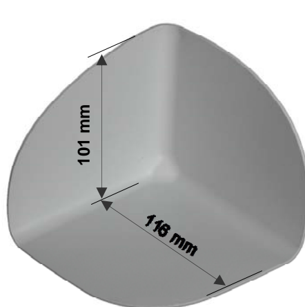
Sarnafil® T hjørne 90° I