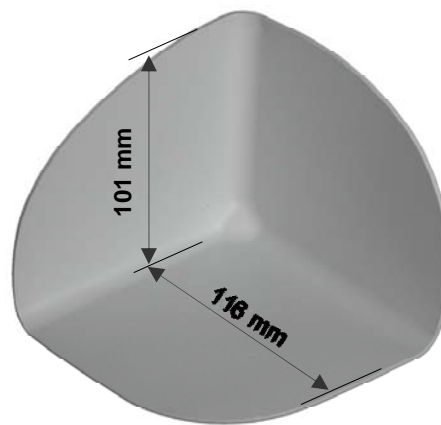
S-hjørne PVC 90° I

S-hjørne PVC 90° I / A har ingen holdbarhedsbegrænsning ved korrekt opbevaring.