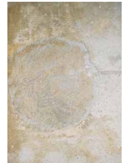
Uvished omkring gamle limrester eller asfaltbaserede underlag