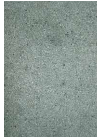
Underlaget er for fugtigt og tiden er knap

Spørgsmålet om underlagskvalitet opstår altid ved renovering og nybyggeri.