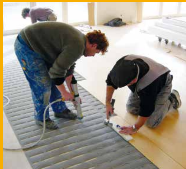
Lyddæmpning med Sika® AcouBond-systemet