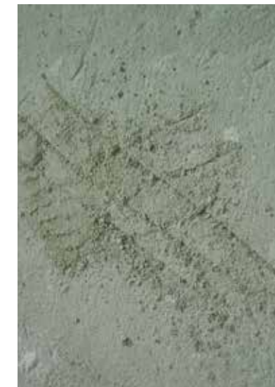
Underlaget er ikke tilstrækkeligt solidt