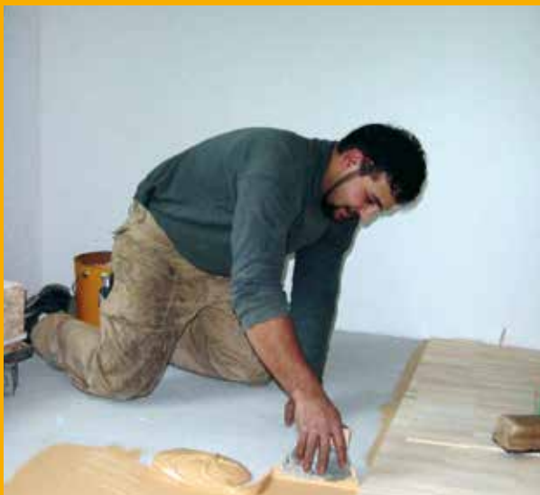
Fuldklæbning inkl. fugtspærre SikaBond®-T64